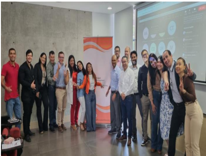
Figura 1. Participación COMITÉ PMO

La Dirección de Especialización en Gerencia de Proyectos, participa activamente en las reuniones mensuales que se lideran desde la Coordinación del Proiect Management Office (PMO). En ese sentido el día 21 de septiembre de 2023, se llevó a cabo la sesión presencial en la Universidad Santiago de Cali, en la cual participó un estudiante de la Especialización en Gerencia de Proyectos, ya que la misma inició con una conferencia sobre TRANSFORMACIÓN ÁGIL EFECTIVA.