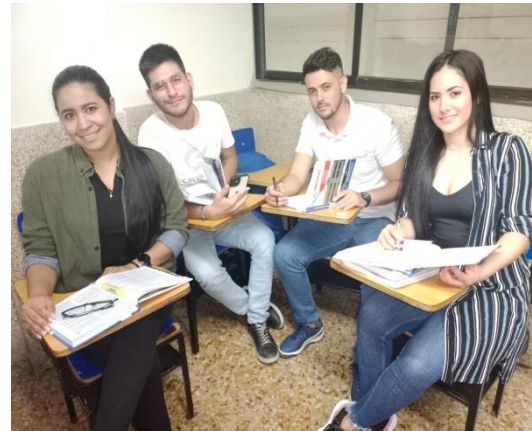
Estudiantes del Programa de Comercio y Finanzas internacionales

En el Semestre 2-2022 la CORPORACIÓN UNIVERSITARIA CENTRO SUPERIOR, UNICUCES recibe a sus nuevos estudiantes, ofreciendo el acompañamiento necesario para la adaptación a la vida universitaria, donde cada dependencia difunde información relevante para su formación integral, como es nuestro objetivo misional