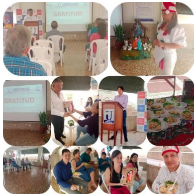
Vice Académica, Decanaturas y Directores

Cerrando las actividades de fin de año, la Directivas de la CORPORACION UNIVERSITARIA CENTRO SUPERIOR, UNICUCES autorizan a la Dirección de Bienestar Institucional para organizar por cada área, las diferentes Novenas Navideñas, como estrategia motivacional de unión alrededor del pesebre, promoviendo el espíritu navideño, el compartir y el trabajo en equipo, para reconocer y agradecer al personal administrativo, culminando la actividad con la Integración de Fin de Año, donde el Consejo Superior de la Institución ofrece detalles y el compartir general, para desear el feliz año a los colaboradores.