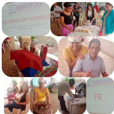
Recepción Soporte Cómputo y Mtto