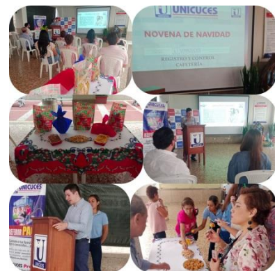
Registro y Control