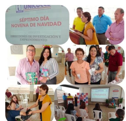
Investigación Y Emprendimiento