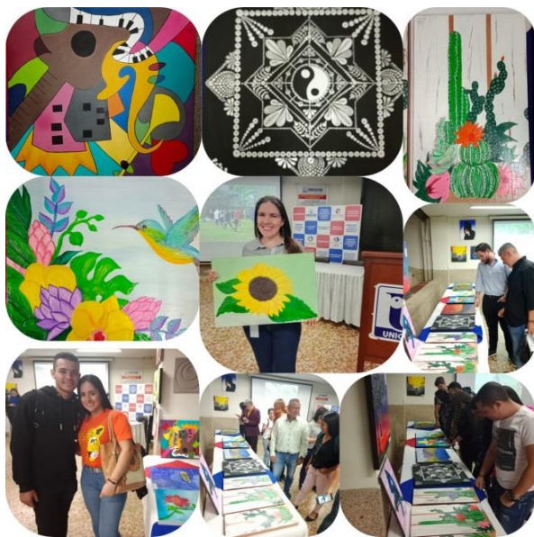
Exposición obras de Estudiantes de la Actividad de Pintura

Adicional se resalta el trabajo de los instructores de las actividades, agradeciendo el apoyo a los estudiantes, para desarrollar dones ocultos y descubrir talentos, para cumplir con el objetivo misional de la Formación Integral.