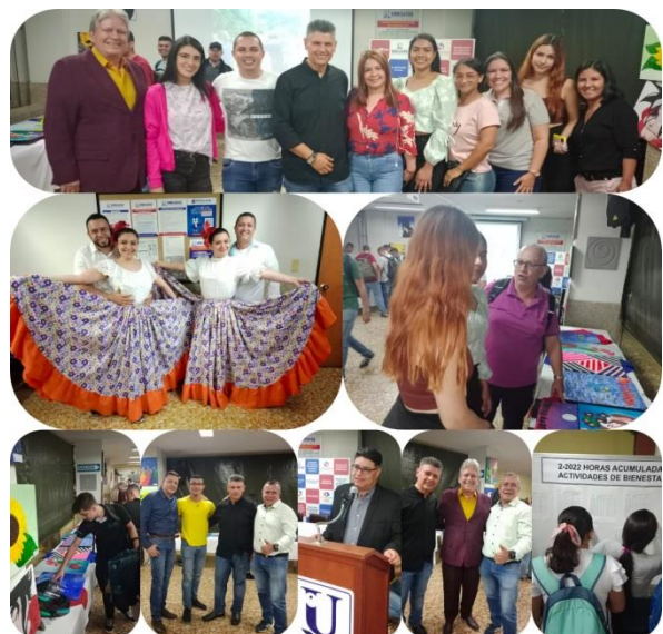
Reconocimiento a Instructores de las diferentes Actividades de Bienestar Institucional