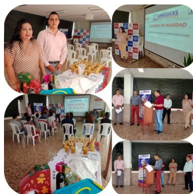
Talento Humano y Contabilidad