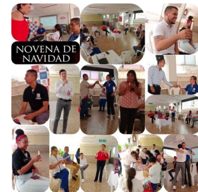
Proyección Social, Biblioteca y Suministro