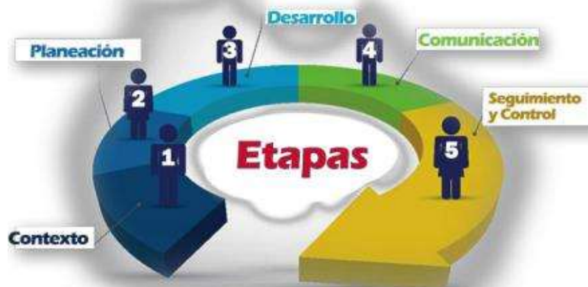
Figura 2. Etapas del Proceso de Autoevaluación UNICUCES